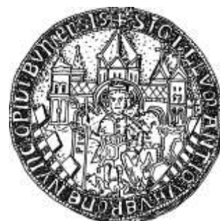
Siegel der Stadt Bonn, 13. Jhd. („früher Verona, jetzt Stadt Bonn“)